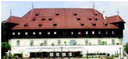
Das Konstanzer Konzilsgebäude heute